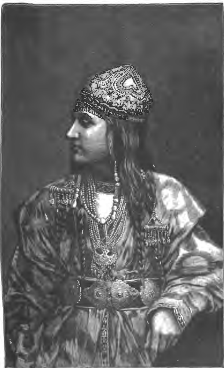
САРТСКАЯ ЖЕНЩИНА. 1883 г.

ПРИЛОЖЕНИЕ КЪ «РУССКОЙ СТАРИНѢ» изд. 1889 г.