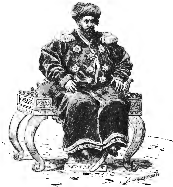
МОЗАФФАРЪ-ЭДДИНЪ, ЭМИРЪ БУХАРСКІЙ.