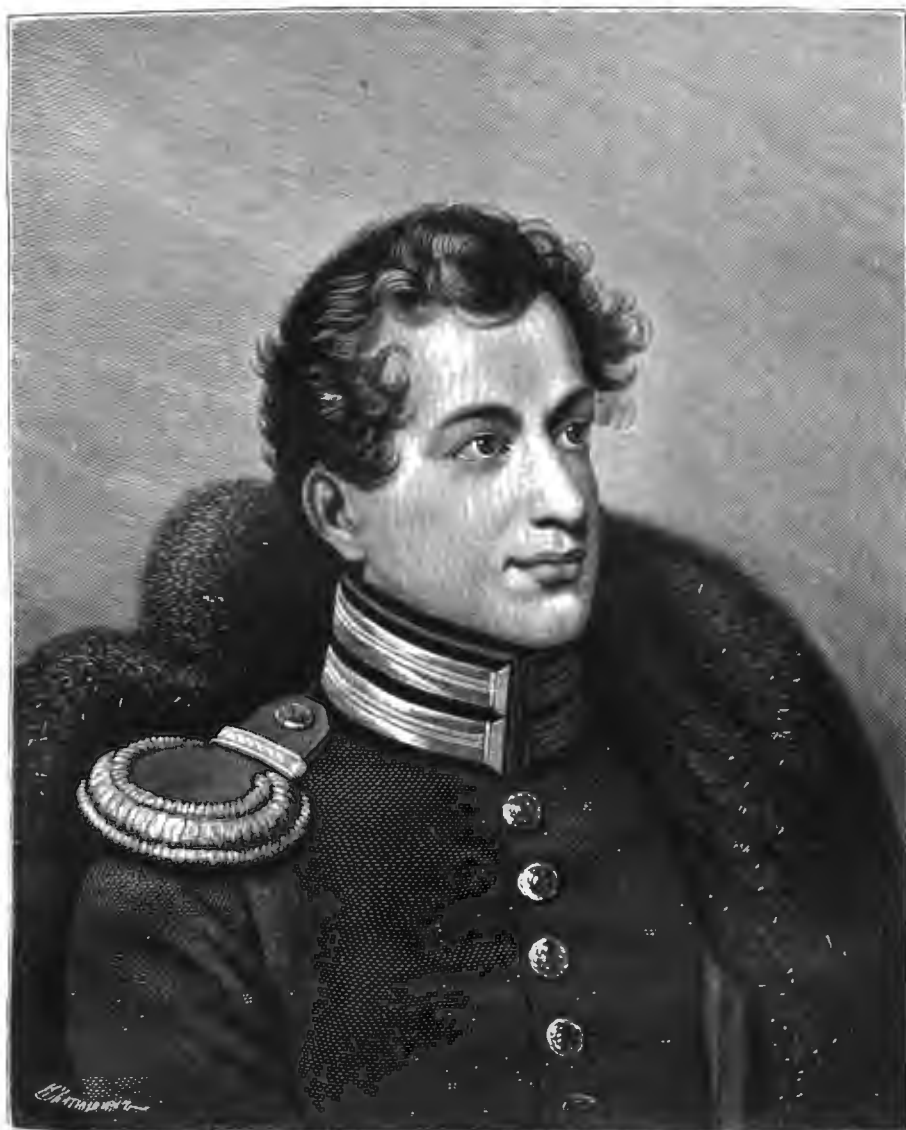
ИВАНЪ АЛЕКСАНДРОВИЧЪ АННЕНКОВЪ.

СЪ ПОРТРЕТА ПИСАННАГО КИПРЕНСКИМЪ ВЪ 1823 Г.