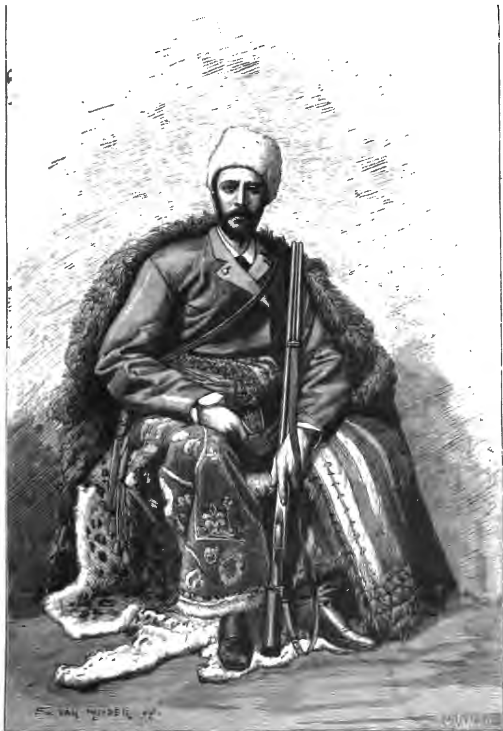
ГЕНРИХЪ МОЗЕРЪ. ВЪ 1863 Г.

ВРЪЛОЖЕНІЕ КЪ «РУССКОЙ СТАРИНѢ» изд. 1889 г.